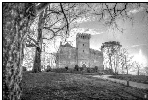
Château de Morlanne